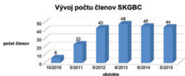
Členské spoločnosti SKGBC podľa veľkosti

ktorých je 31. Spoločnosti do 50 zamestnancov sú medzi členmi SKGBC dve a viac ako 50 zamestnancov má 9 členských spoločností. V tejto kategórii sa zvlášť uvádzajú dvaja pridružený členovia.